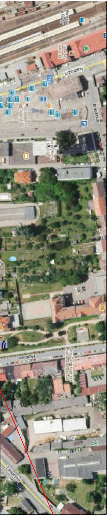
PŘEHLEDNÁ SITUACE UMÍSTĚNÍ STAVBY